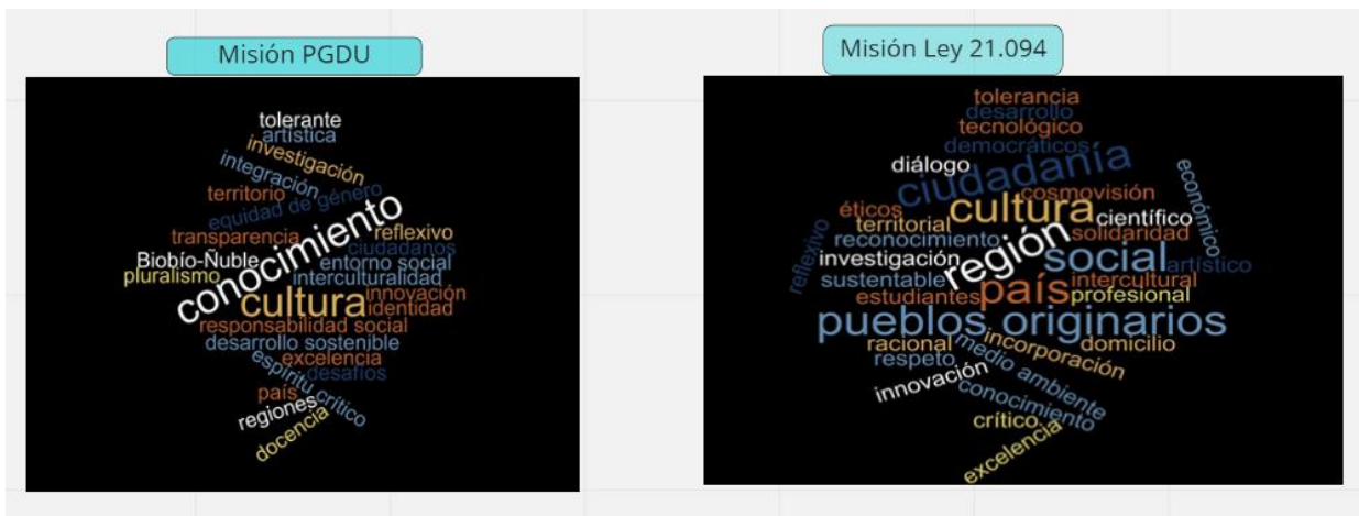
Ilustración 1 Misiones PGDU y Ley 21.094