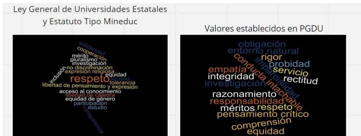
Ilustración 2 Principios de Ley 21.094-DFL4 y Valores de PGDU

En el caso de los Principios, se presentaron dos nubes de palabras, una referida a los conceptos que establece la propuesta de Estatuto tipo emanada desde el Ministerio de Educación (DFL 4/2019) y la Ley general de Universidades Estatales (21.094/2018), y la otra referida a los valores establecidos por el PGDU 2020. Luego de compartir con las participantes las nubes de palabras, se introdujo la siguiente pregunta: